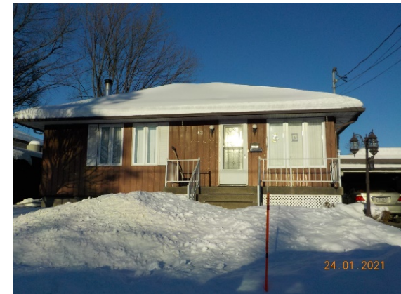
43, 32 e Avenue (voisin de droite)