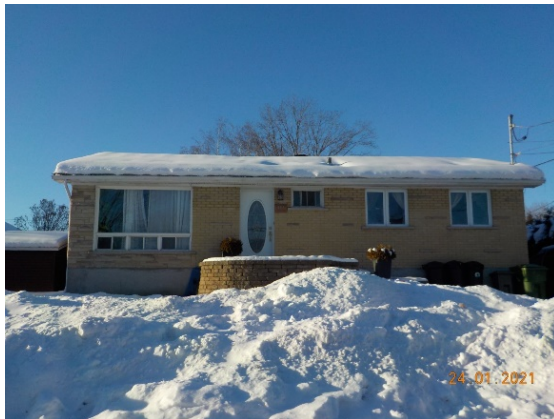
383, rue Wilfrid (voisin de gauche )