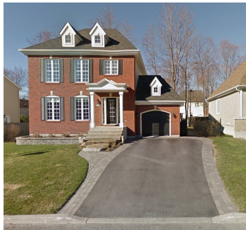
380, avenue des Saules (emplacement faisant l'objet de la demande)