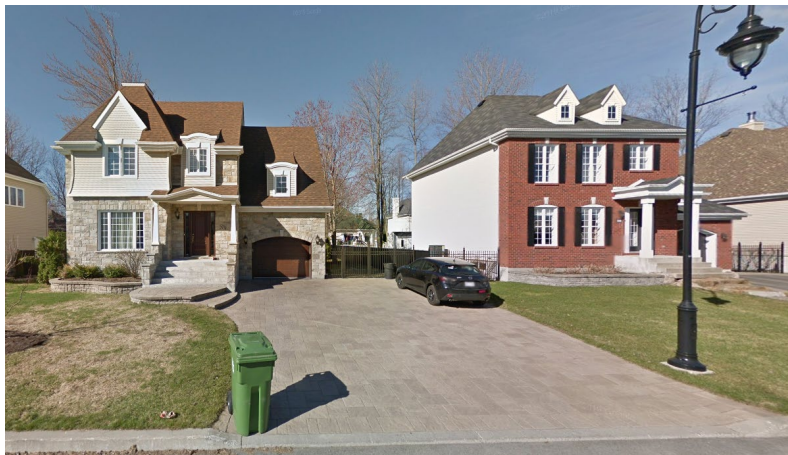
378, avenue des Saules (voisin de gauche)