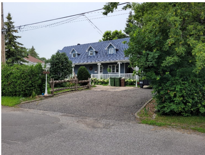
23, 26 e Avenue (voisin de gauche)