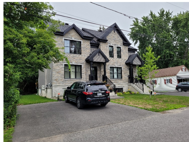
15, 26 e Avenue (voisin de droite)