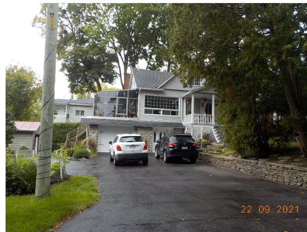
10, 47 e Avenue (voisin de droite)