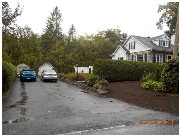
6, 47 e Avenue (emplacement faisant l'objet de la demande)