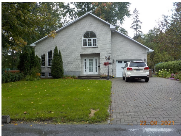
4, 47 e Avenue (voisin de gauche )