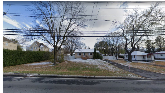
308, boulevard Adolphe-Chapleau (voisin de droite)