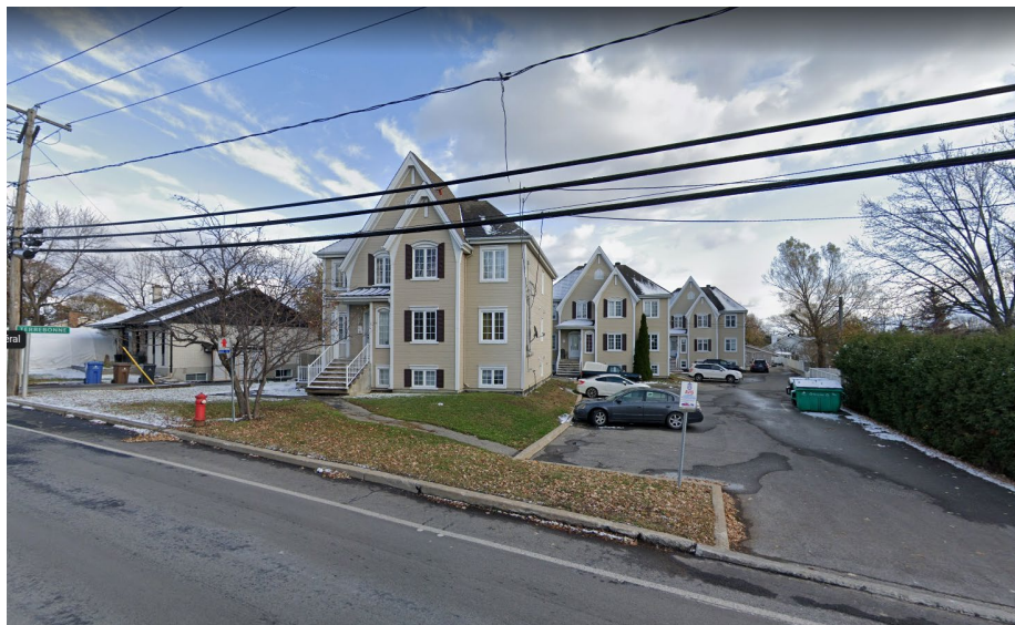
290 à 294, boulevard Adolphe-Chapleau (emplacement faisant l'objet de la demande)