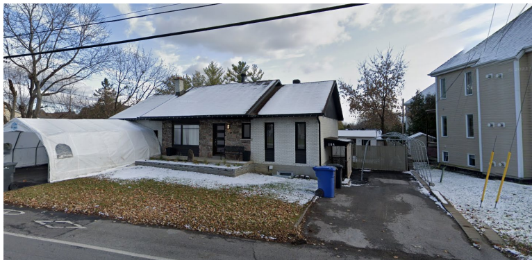
10, côte de Terrebonne (voisin de gauche)