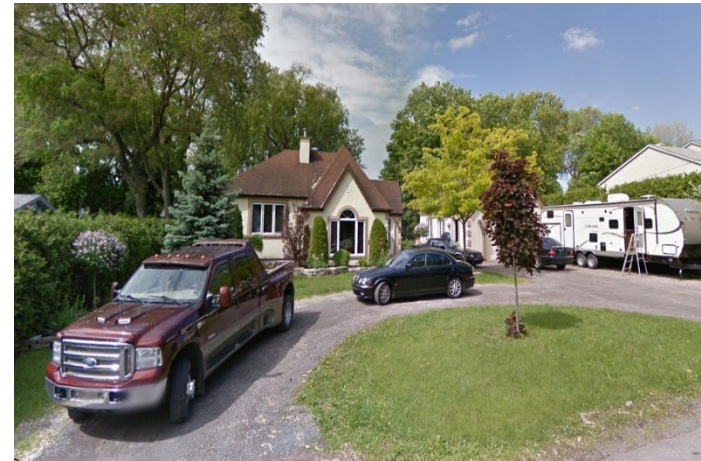
6, 29 e Avenue* (voisin de droite)