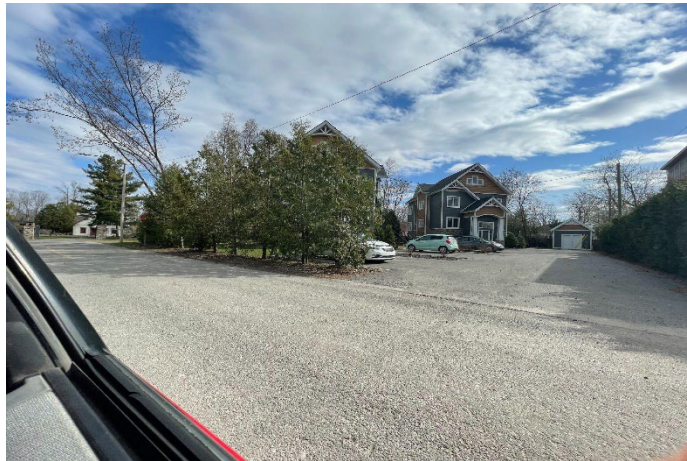
2, 29 e Avenue (voisin de gauche)