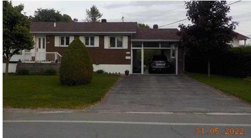
384, rue Joseph-Germain (emplacement faisant l'objet de la demande)