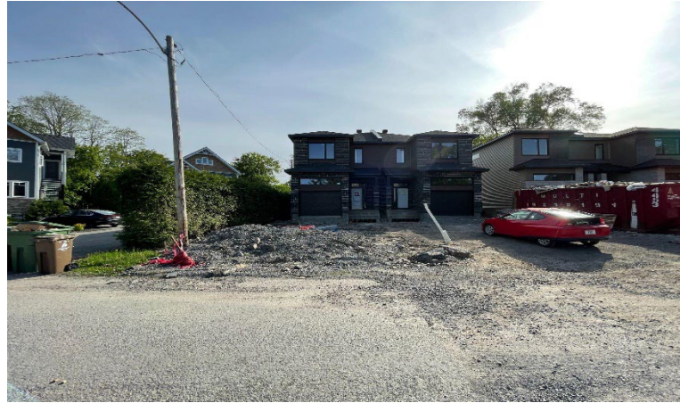
4 et 4A, 29 e Avenue (en construction) (emplacement faisant l'objet de la demande)