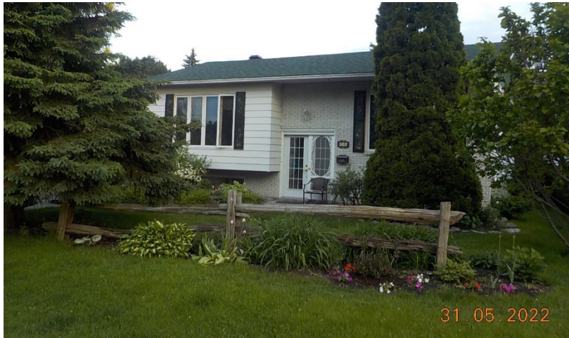
382, rue Joseph-Germain (voisin de gauche)