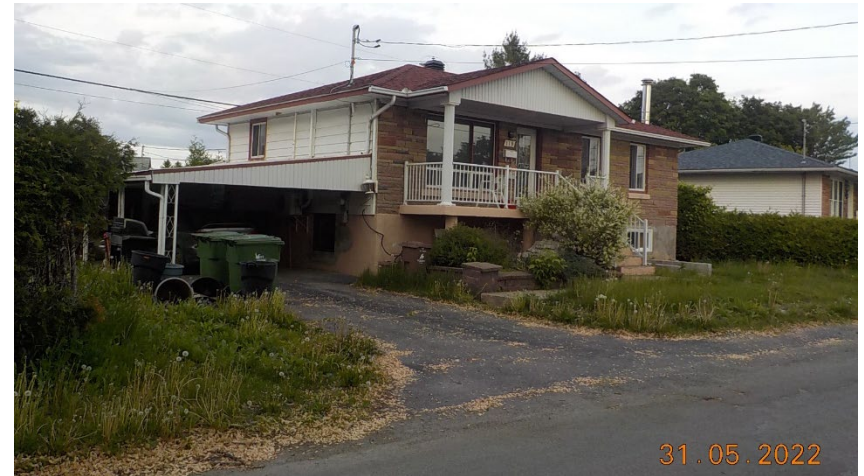
119, 33 e Avenue (voisin de droite)