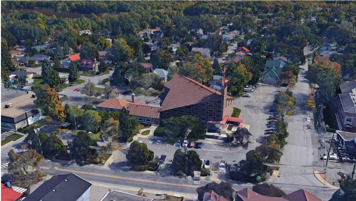
6. Localisation du lot 5 685 992 dans son contexte

Pour toutes ces raisons, le bâtiment situé au 388, boulevard Adolphe-Chapleau est cité pour ses valeurs emblématiques et architecturales.