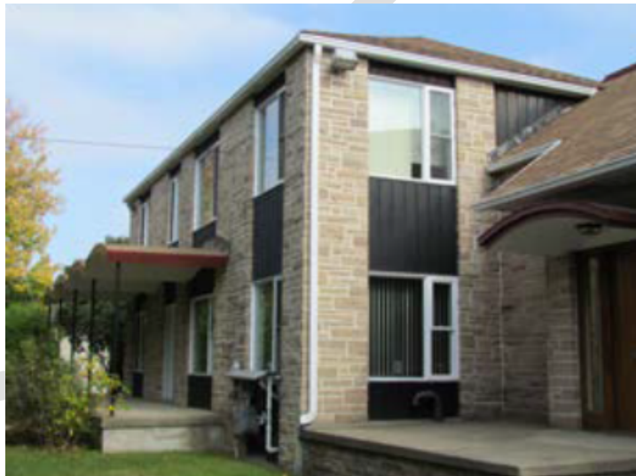
4. Église Saint-Maurice