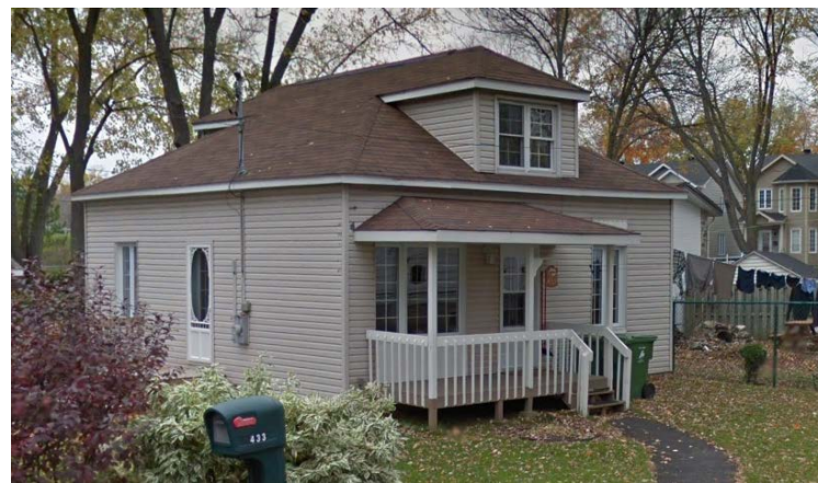
433, rue Goyer (voisin de droite)