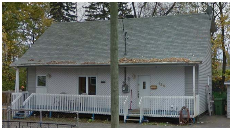
435, rue Goyer (emplacement faisant l'objet de la demande)