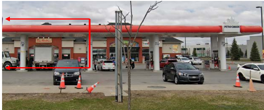
903, boulevard Industriel (emplacement faisant l'objet de la demande)