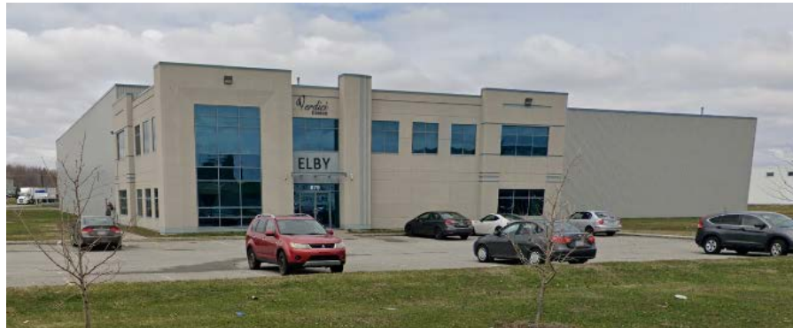
879, boulevard Industriel (voisin de droite)