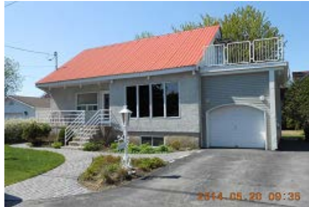
42, 32 e avenue (emplacement visé par la demande – Photo prise dans Accès Cité Territoire)