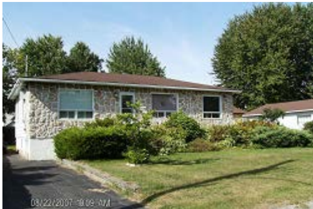
38, 32 e avenue (voisin de gauche – Photo prise dans Accès Cité Territoire)