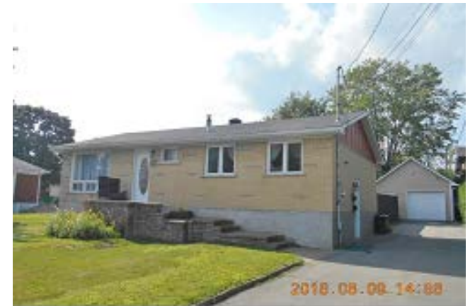
383, rue Wilfrid (voisin de droite – Photo prise dans Accès Cité Territoire)