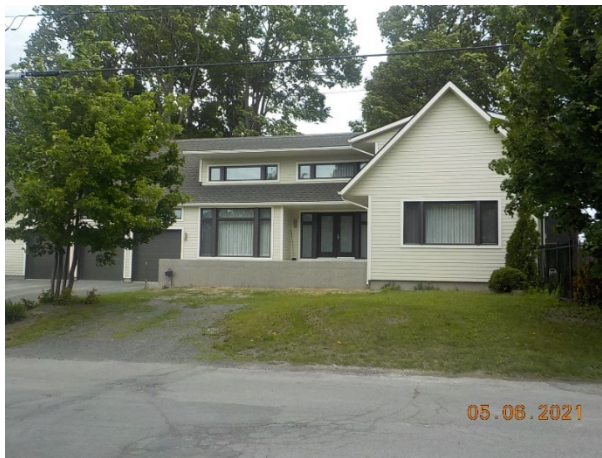
45, 42 e Avenue (voisin de gauche)