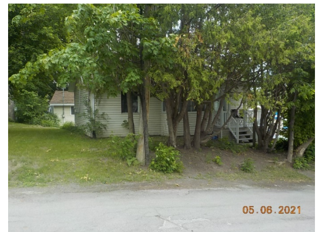
35 et 37, 42 e Avenue (voisin de droite)