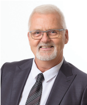
M. Gilles Blanchette Maire de la Ville de Bois-des-Filion

La démarche MADA (Municipalité amie des aînés) complétée par la Ville a pour objectif d'assurer un milieu de vie de qualité aux aînés de Bois-des-Filion. La présente politique propose dans son plan d'action plusieurs initiatives en ce sens.