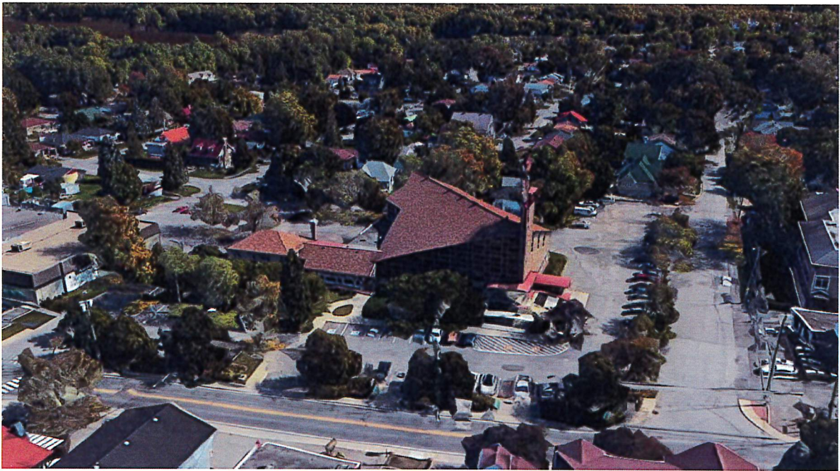
3. Localisation du lot 5 685 992 dans son contexte

Pour toutes ces raisons, le bâtiment situé au 388, boulevard Adolphe-Chapleau est cité pour ses valeurs emblématiques et architecturales.