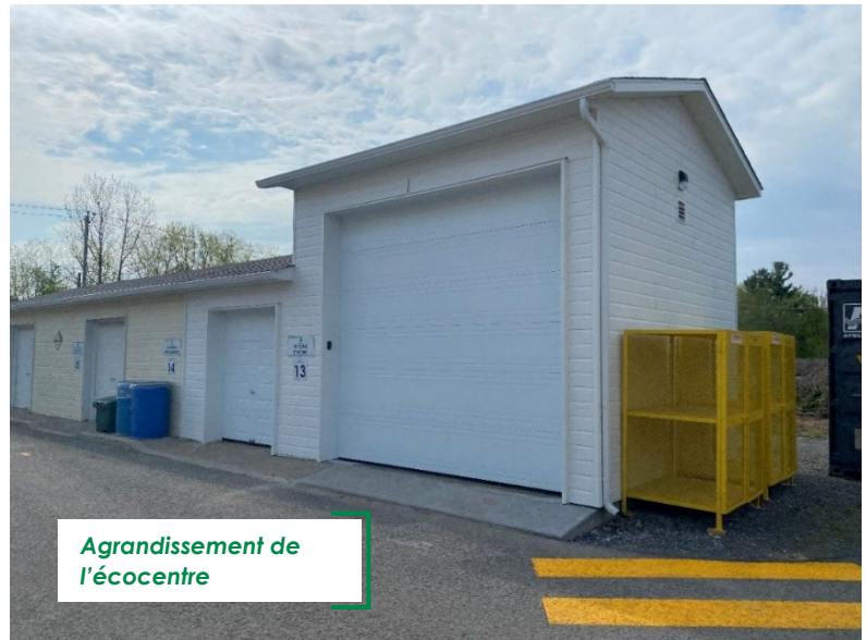
Agrandissement de l'écocentre