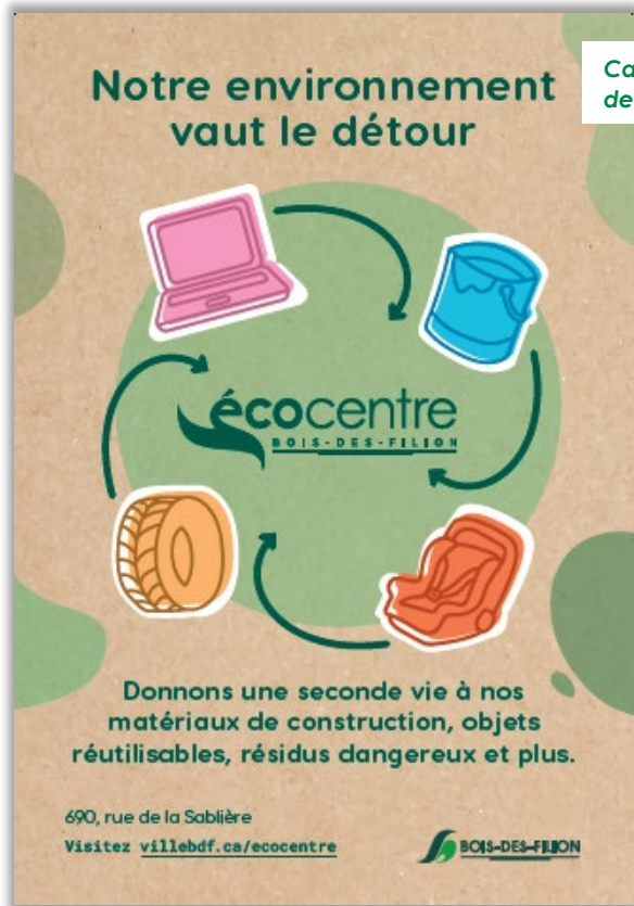
Campagne de promotion de l'écocentre