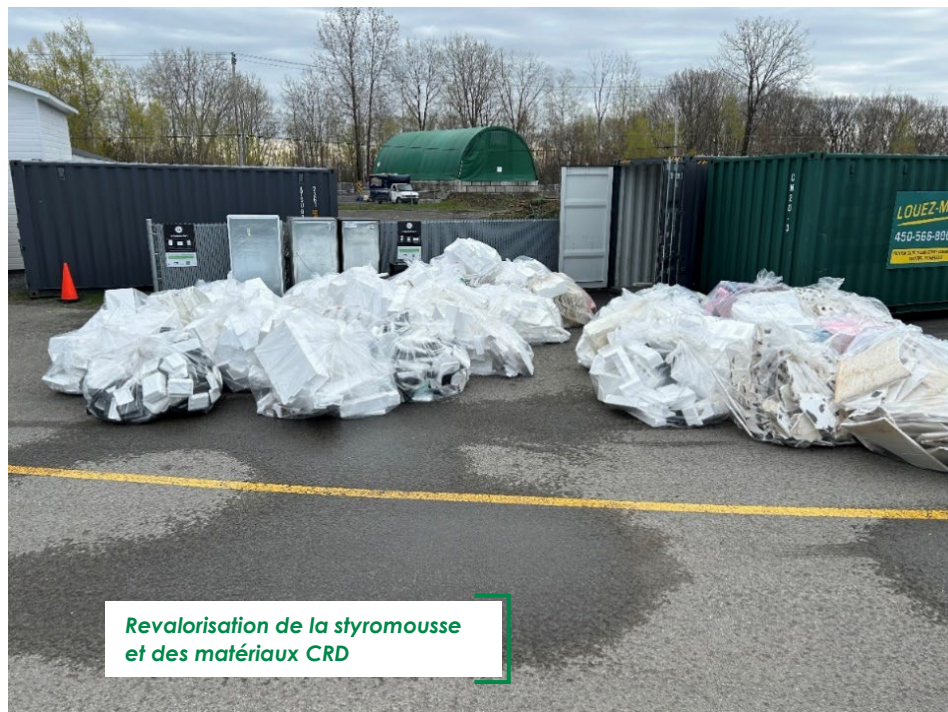
Revalorisation de la styromousse et des matériaux CRD